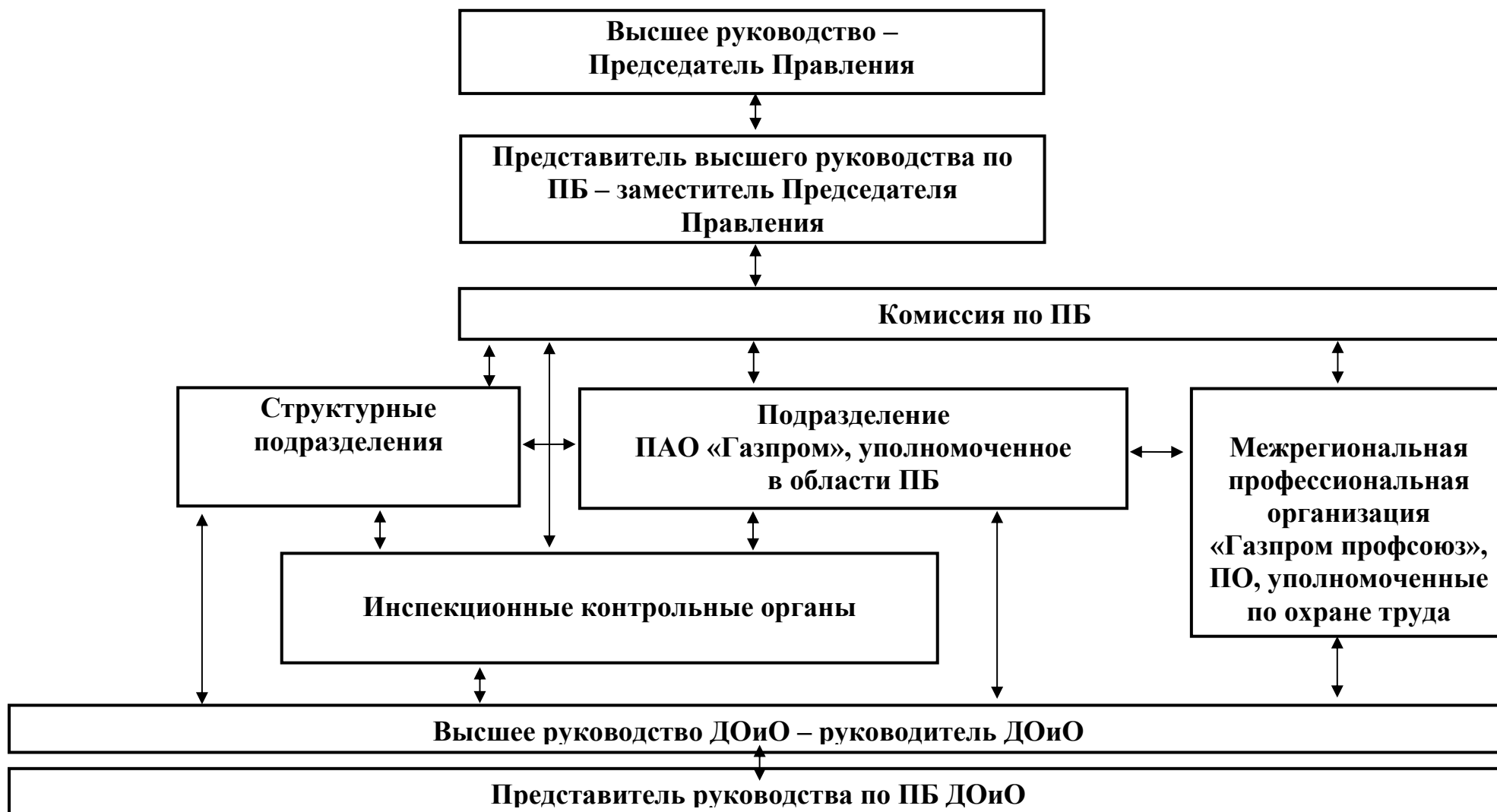
Схема структуры Единой системы управления производственной безопасностью в ПАО «Газпром»